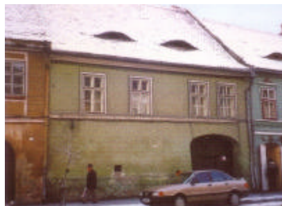
Im Garten hat unser Zimmermann Thomas

Mit der Renovierung der Spiel- und Therapiezimmer in unserem neuen Haus war es nicht allein getan. Sämtliche sanitären Anlagen, Heizung, Gas-, Wasser- und Stromanschlüsse mussten erneuert werden. Mittlerweile sind alle Räume neu gestaltet und werden rege genutzt. Inzwischen haben wir ein großes Spielzimmer, zwei Therapieräume, Büro, Bad, Küche und eine Freiwilligenwohnung. Auf dem Dachboden gibt es ein Lager für